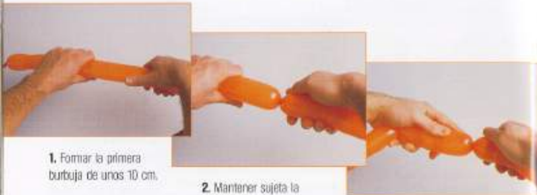
1. Formar la primera burbuja de unos 10 cm.

Es el giro que más se usa. Recordar que hay que mantener sujeta la primera burbuja realizada mientras se modelan las demás, de otra manera se soltaría.