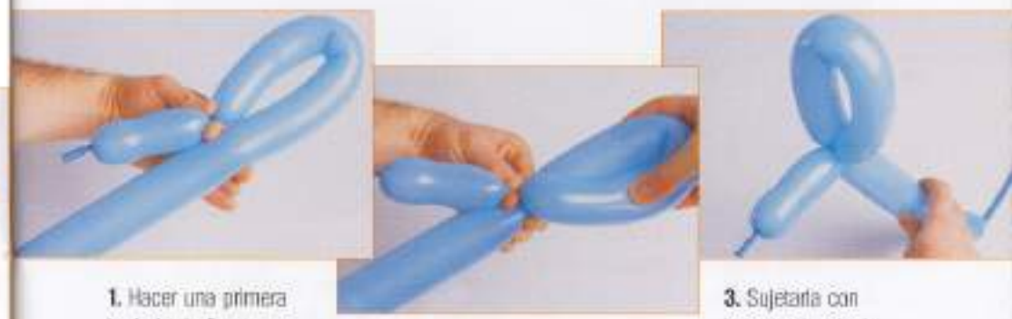
1. Hacer una primera burbuja de 8 cm.