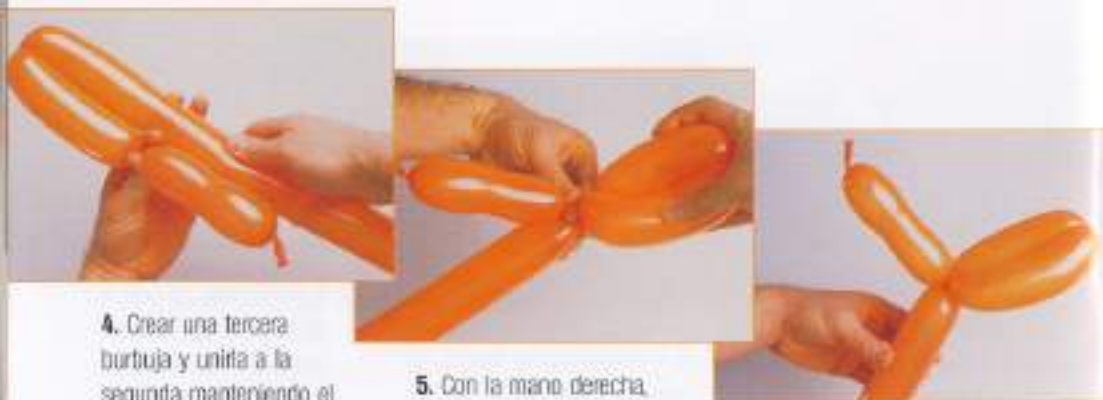
4. Crear una tercera burbuja y unirla a la segunda manteniendo el globo en la mano izquierda.