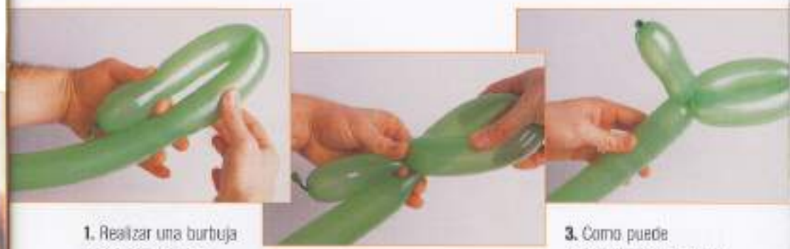
1. Realizar una burbuja de 20 cm. Doblarla sobre el globo.

El giro básico puede hacerse más rápidamente, saltándose la ejecución de algunos pasos.